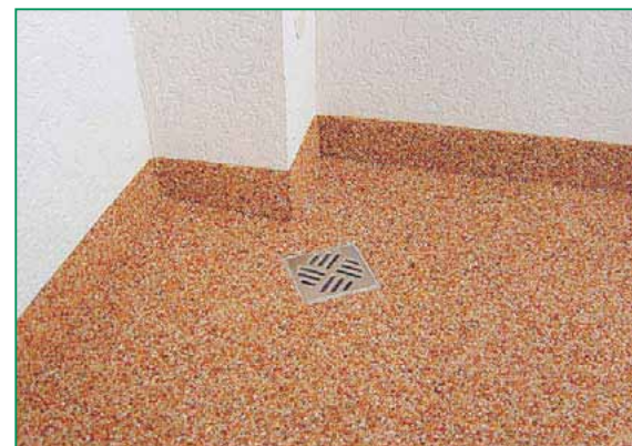
Sistem: acoperire de suprafață cu pietre naturale HADALAN® PUR