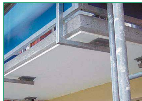
Substrat: Vopsea silică VESTEROL® cu rol de mortar de reparare și compus pentru nivelare fină