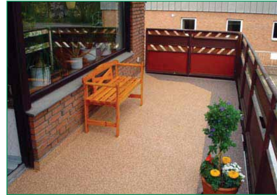
Sistem: acoperire de suprafață cu pietre naturale HADALAN® PUR