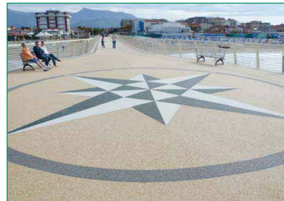
Sistem: acoperire de suprafață cu pietre naturale HADALAN® PUR