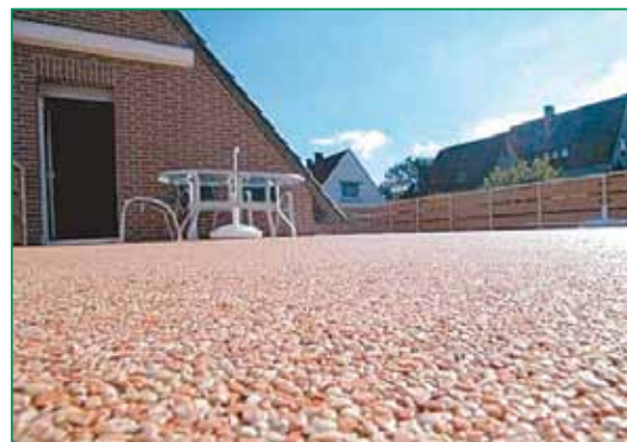
Sistem: acoperire de suprafață cu pietre naturale HADALAN® PUR