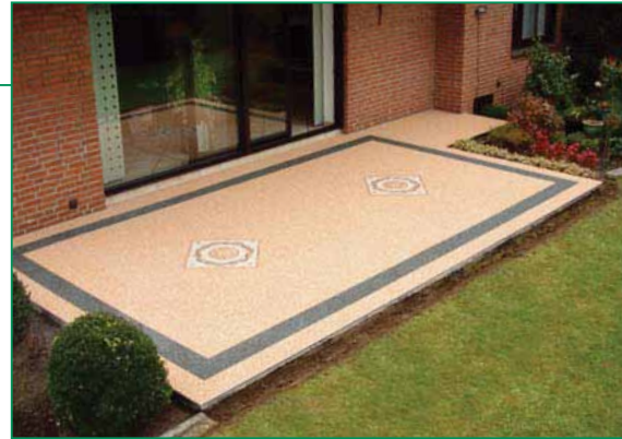
Sistem: acoperire de suprafață cu pietre naturale HADALAN® PUR