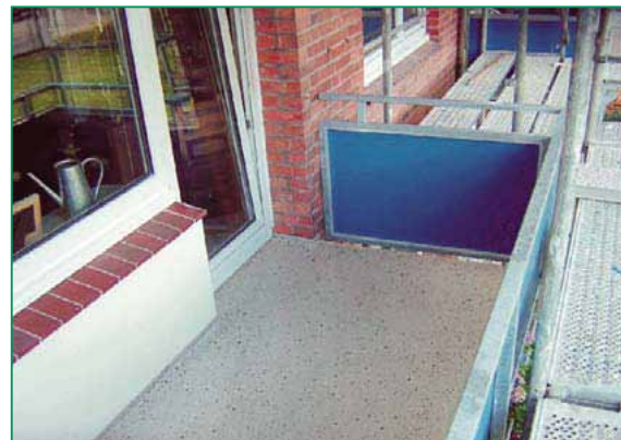
Sistem: HADALAN® PUR cu pietricele colorate intercalate